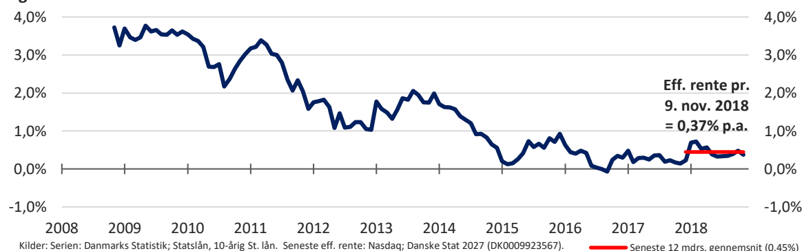
Figur 1. Den risikofri rente

Den aktuelle effektive rente af en 10-årig statsobligation ligger i niveauet 0,37% p.a., hvilket er 0,32%-point lavere end i januar 2018 og 0,08%-point lavere end gennemsnittet for de seneste 12 måneder.